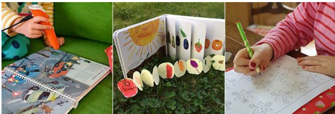
Auch der Nachwuchs des RBIT-Teams weiß sich im Homeoffice zu beschäftigen

Das RBIT-Team befindet sich immer noch alternierend im Homeoffice. Unsere Räume in der Zeithstraße sind mit reduzierter Mannschaftsstärke aber zu unseren bekannten Öffnungszeiten besetzt. Termine bei Ihnen vor Ort nehmen wir gerne unter Einhaltung der notwendigen Sicherheitsvorkehrungen wahr. Alternativ stehen wir Ihnen mit Support per Fernwartungen und Hotline zur Verfügung.